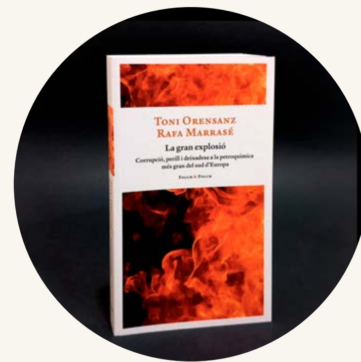
La gran Explosió