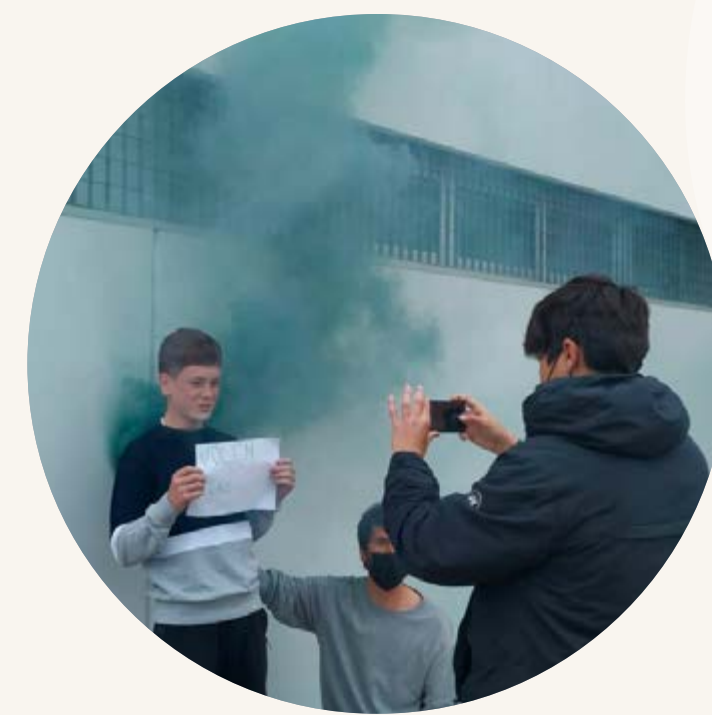
És a l'aire