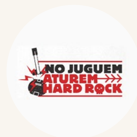
Plataforma Aturem Hard Rock