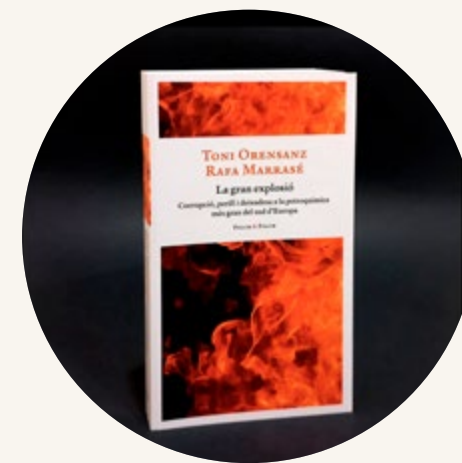
La gran explosió