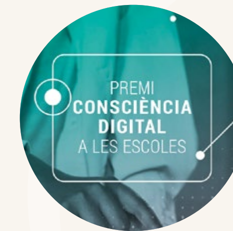
Premi Consciència Digital a les escoles