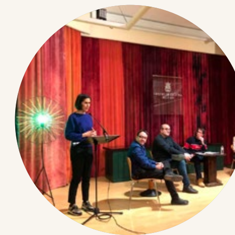
Cicle de diàlegs Llum Verda